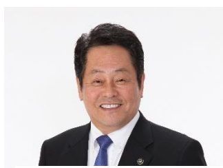
尾張北部環境組合 管理者 澤田 和延 (江南市長)

このたび管理者 2 期目の就任にあたりましてごあいさつ申し上げます。7月26日に開会されました令和元年第1回尾張北部環境組合議会臨時会の管理者選挙におきまして、組合議員の皆様方から引き続き、管理者としてご推挙いただきました。大変光栄に存じますとともに、責任の重さを改めて感じているところでございます。