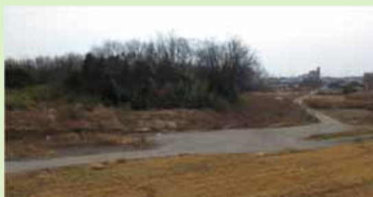
建設地(江南市中般若町北浦地内)